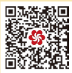
QR-код для предварительной регистрации иностранных покупателей

Для удобства и экономии времени иностранным покупателям предлагается пройти предварительную регистрацию и получить бейдж покупателя заранее и в других местах, а не в Кантонском выставочном комплексе. До прибытия в выставочный комплекс иностранные покупатели могут бесплатно получить бейдж покупателя в других местах регистрации, таких как международный аэропорт Гуанчжоу Байюнь и определенные гостиницы в Гуанчжоу, пройдя предварительную регистрацию. После предварительной регистрации, Вы можете получить бейдж на безвозмездной основе и информацию Кантонской ярмарки Для получения последней информации обращайтесь на официальный сайт Кантонской ярмарки.