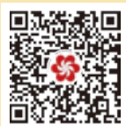
Código QR para o Pré-registo de Compradores Internacionais

Para melhor experiência de obtenção de crachá, sugerimos que digitalize o código QR abaixo para fazer o pré-registo, tirando o crachá gratuitamente sem esperar na fila longa no local, em locais alternativos como o aeroporto e os hotéis designados. Para informações mais recentes, por favor, consulte o site oficial da Feira de Cantão.