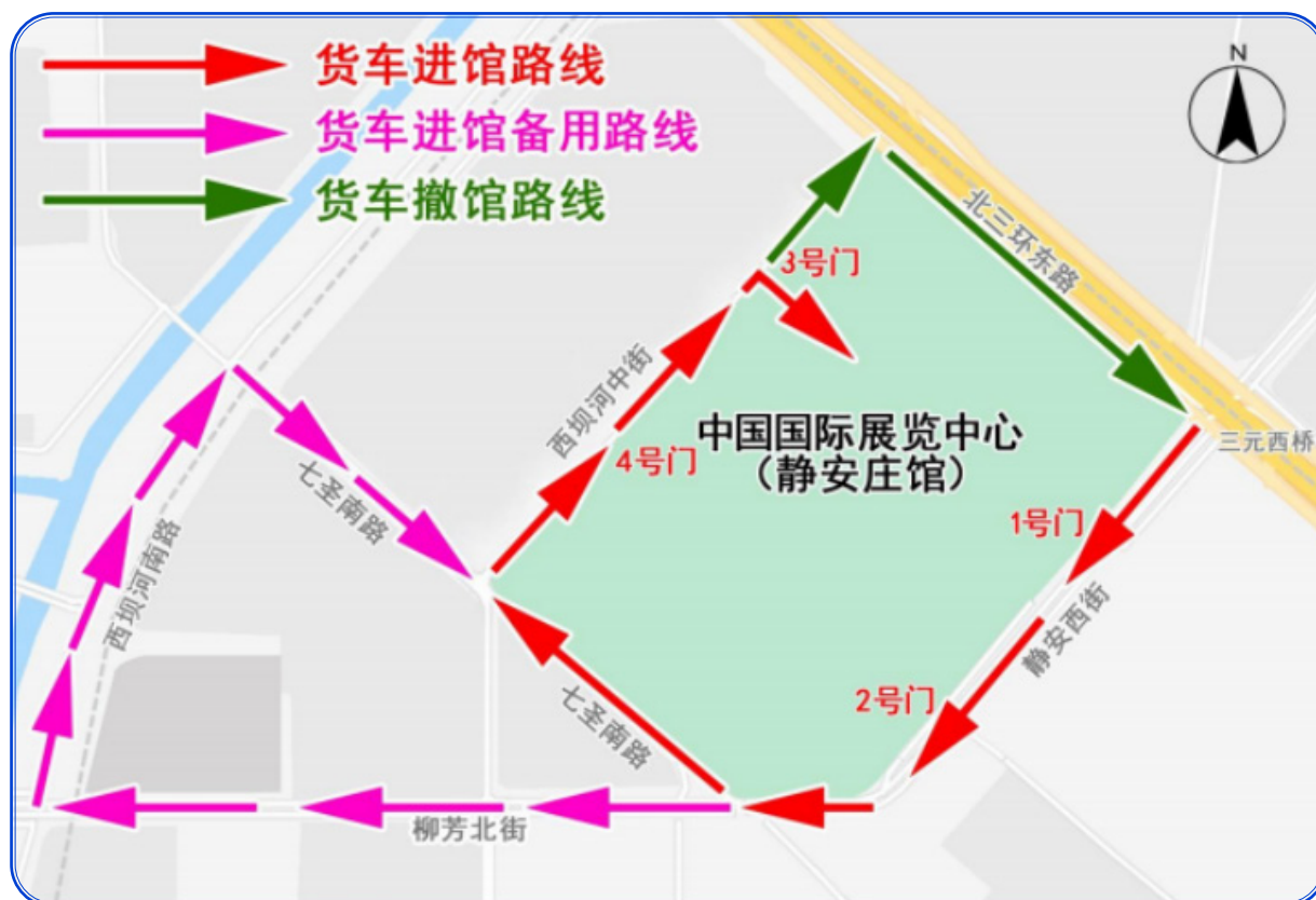
货车进出馆示意图