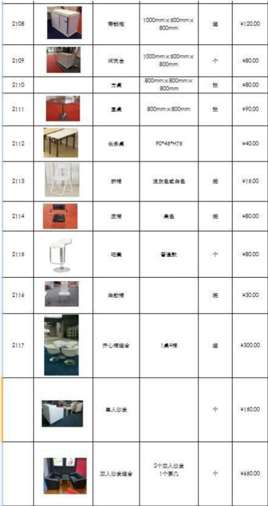
表格十一： 标准展位家具及照明租赁申请表 （仅限标准展位） （截止日期： 2024 年 11 月 18 日） （根据需要填写）